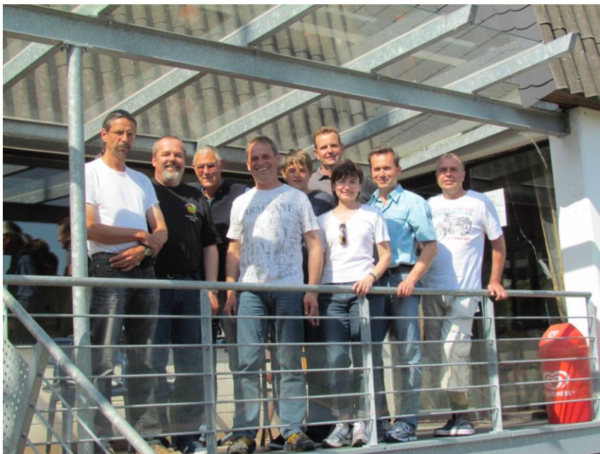
Teilnehmer SBF See