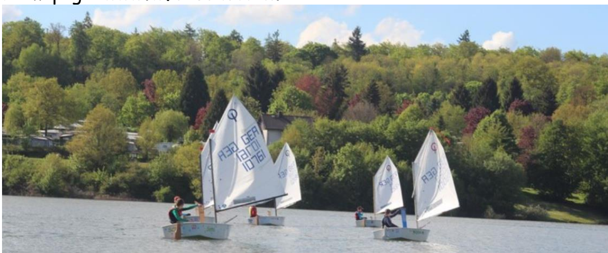
WFC-Kids in Optimisten auf dem Niddastausee

Weitere Informationen zum Verein findest Du auch auf unserer Homepage: www.wfc-schotten.de